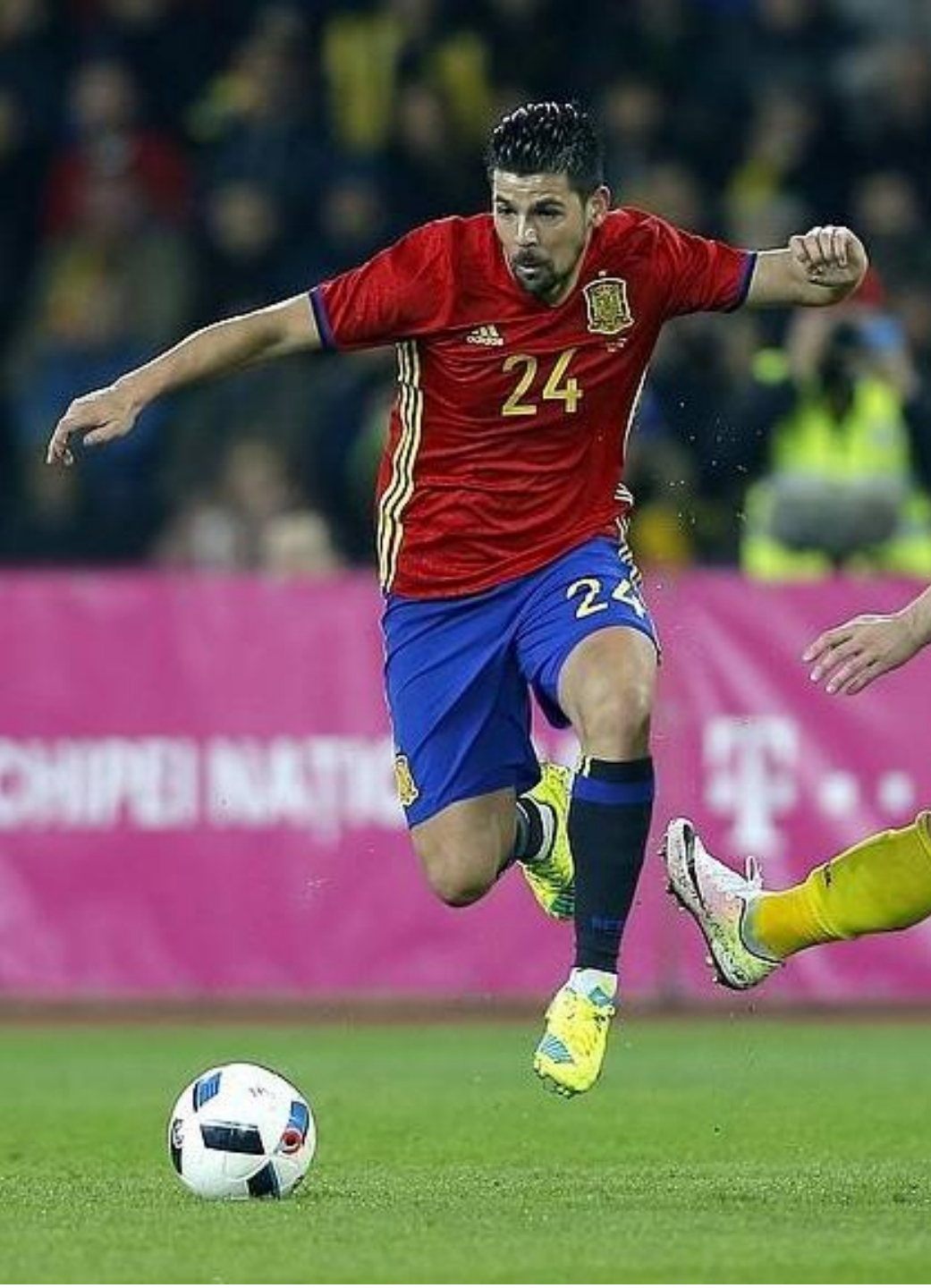
Image: Nolito in actie voor Spanje.

Natuurlijk! (En geweldig om voor een Spaans international te mogen werken)